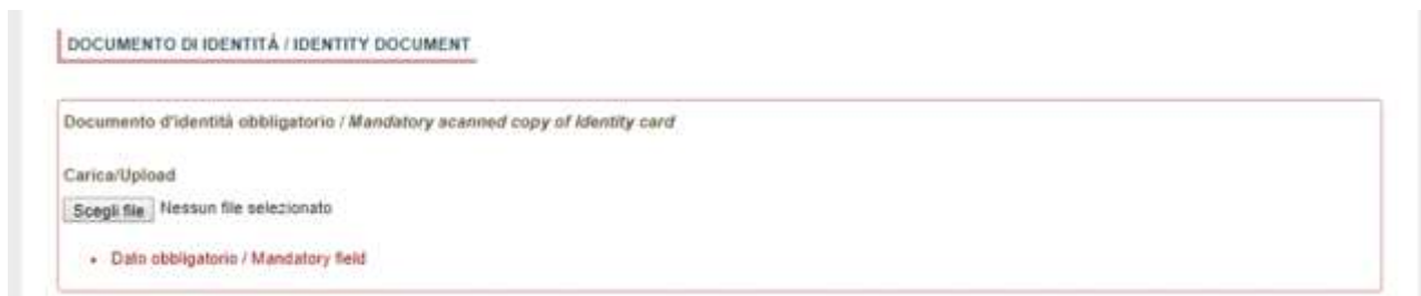
Fig. 11 – Sezione “Allegati”, voce “Documento di identità’/...” Section “Attachments”, field “identity document”