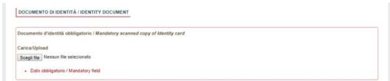
Fig. 11 – Sezione “Allegati”, voce “Documento di identità’/...” Section “Attachments”, field “identity document”