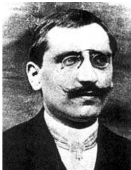
Figura: Henri Lebesgue (1875-1941).

Questo teorema è utile, perchè fa capire che se la costante di Lebesgue è piccola allora l'errore compiuto dall'interpolante polinomiale è poco più grande dell'errore di miglior approssimazione uniforme.